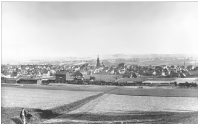
Historische Aufnahme des Oberen Bahnhofs mit Grüna um 1910

Der obere Bahnhof lag am Kilometer 9,8 der Bahnlinie Limbach – Wüstenbrand. Als deren letzte Zwischenstation hielten hier vom 1. Dezember 1897 bis zum 29. Dezember 1950 Personenzüge. Bis 23. September 1910 hatte die Station die offizielle Bezeichnung „Obergrüna“, anschließend „Grüna (Sachsen) oberer Bahnhof“.