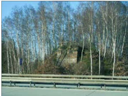
Widerlager der Auritztalbrücke an der A4

Am Ortseingang von Rabenstein (bis 1897 Oberrabenstein) verlief die Bahn