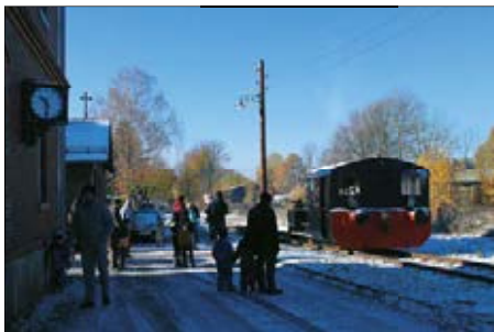
Bahnhofsfest November 2022 mit Kleindiesellok