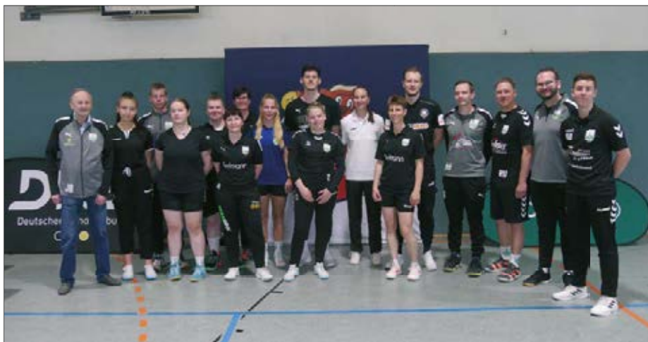
Trainerteam des HV Gröna zum AOK-Startraining

In den einzelnen Jugendmannschaften wurden extra Weihnachtsfeiern von den Übungsleitern organisiert, welche aber aus Termingründen zum Großteil im Januar/Februar stattfinden mussten bzw. noch werden. Die Jungs und Mädels der B-Jugend verbrachten zum Beispiel einen geselligen Abend im Vereinszimmer, inklusive Übernachtung in der Turnhalle und gemeinsamen Frühstück (immer wieder ein Highlight bei den Jugendspielern).