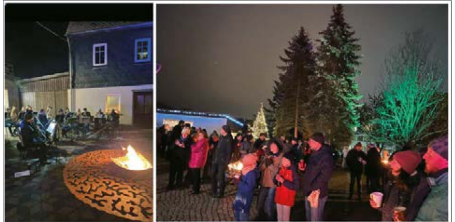
Auf dem Egerhof.