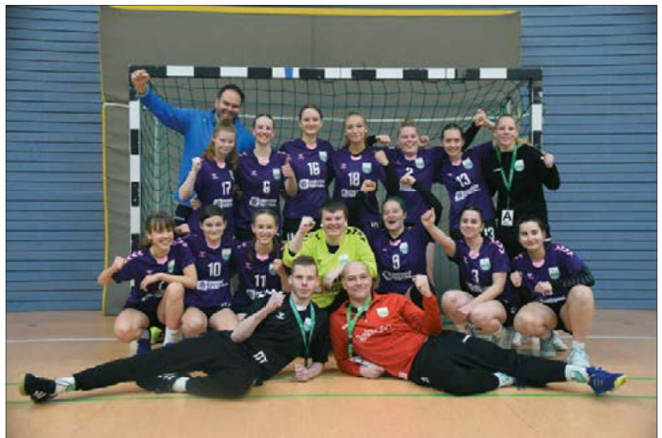
Die erfolgreichen A-Jugend-Mädels nach einem 33:13 Sieg in Eilenburg