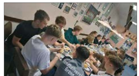
Gemeinsames Frühstück nach der Weihnachtsfeier