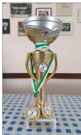
Pokal unserer B-Jugend Mädels der Saison 2021/22

Nur die Weihnachtsfeier der E-Jugend fand noch vor Weihnachten statt, am 22.12.2022 im Indoorspielplatz Jump'n Play in Chemnitz. Für die Mädels und Jungs stand gemeinsam mit ihren Trainerinnen ein entspannter Nachmittag auf der Trampolinanlage bzw. mit den anderen Beschäftigungsmöglichkeiten auf dem Programm.