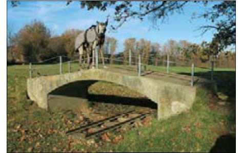
Denkmal an der „Eselsbrücke“

durch einen Geländeeinschnitt. Auf einem Betonbogen querte die Bergstraße (heute Kreisigstraße) bei km 5,81 den Einschnitt. Da noch vor der offiziellen Einweihung der Brücke Strumpfwirker mit einem Eselskarren das Bauwerk passierten, taufte der Volksmund sie zugleich zur „Eselsbrücke“. Seit 2004 erinnern Heimatfreunde mit einem Denkmal an diese Brücke.