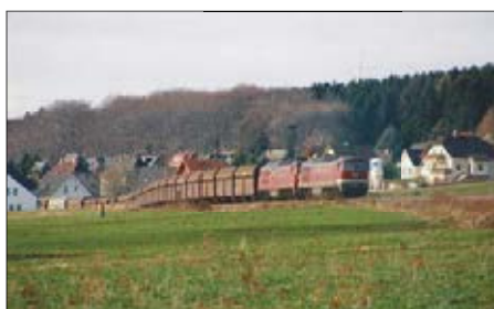
Kohlezug Ende der 90er Jahre

Ein Transformatorentausch mittels Eisenbahn erfolgte letztmals im Dezember 1997. Mit der am 11. Dezember 2001 durch das Eisenbahn-Bundesamt genehmigten Stilllegung der Strecke Limbach – Wittgensdorf oberer Bahnhof verlor auch das Anschlussgleis seine Existenzgrundlage. „Auf der anderen Seite“ wurden die 1903 erbaute Güterstrecke Küchwald – Grüna und das Reststück der Limbacher Strecke auf Wüstenbrander Seite zur Strecke Küchwald – Wüstenbrand vereinigt, die Kilometrierung passte man erst in den 1980er-Jahren an. Während der Elektrifizierung der Hauptstrecke zwischen Karl-Marx-Stadt und Wüstenbrand leitete man 1964 zeitweise den Gesamtverkehr über die Güterbahn. Den immer schlechter werdenden Gleiszustand milderte man in den 1980ern sukzessive mit überwiegend gebrauchtem Gleismaterial ab.