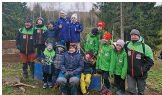
Mit neun „Miniskifliegern“ waren wir zum Wettkampf in Rodewisch – und das sehr erfolgreich.

Unsere größeren Sportler nutzten die Gelegenheit gleich zum Training auf den größeren Schanzen in Rodewisch. Es ist schließlich wichtig, über den Tellerrand hinauszublicken und andere Schanze zu erkunden.