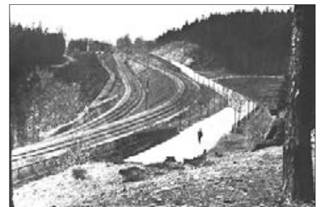
Abzweig am Schützenhaus ca. 1910 (rechts: Strecke nach Limbach, links: Strecke nach Chemnitz)

Trotzdem gab es Bestrebungen, eine weitere Bahnverbindung gen Süden zu errichten, um direkten Anschluss an die Hauptstrecke Dresden – Werdau und das Lugau-Oelsnitzer Steinkohlenrevier zu erlangen. Von vier möglichen Trassenvarianten wurde 1892 schließlich die kostengünstigste, nämlich die „Ostumfahrung des Totensteins“ mit Anbindung der Orte Kändler, Röhrsdorf/Löbenhain, Rabenstein und Grüna auserkoren. Wüstenbrand als Einfädelpunkt bot zugleich direkten Anschluss an die Hauptbahn und die dort abzweigende Strecke nach Lugau bzw. Höhlteich (heute Neuoelsnitz) und somit an die Kohlevorkommen. Die Bewilligung der finanziellen Mittel – es waren 2.483.000 Mark veranschlagt worden – erfolgte im Frühjahr 1894 durch zwei Kammern der Ständeversammlung Dresden. Der Bau der 12,14 km langen Strecke begann im Frühjahr 1896 und war im Oktober 1897 weitestgehend abgeschlossen.