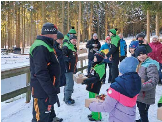
Überraschung für die Trainerinnen und Trainer: Es gab Weihnachtsgeschenke, überreicht von den eigenen Schützlingen

Mit im Gepäck zum letzten Training vor der kleinen Weihnachtspause hatten unsere Sportler und ihre Eltern: Geschenke für die Übungsleiterinnen und Übungsleiter. Die Freude darüber war groß, denn nun schmücken wunderschöne WSV-Gröna-Schwibbögen die Wohnzimmer unserer ehrenamtlichen Trainer. Im Namen der Beschenkten ein großes Dankeschön!