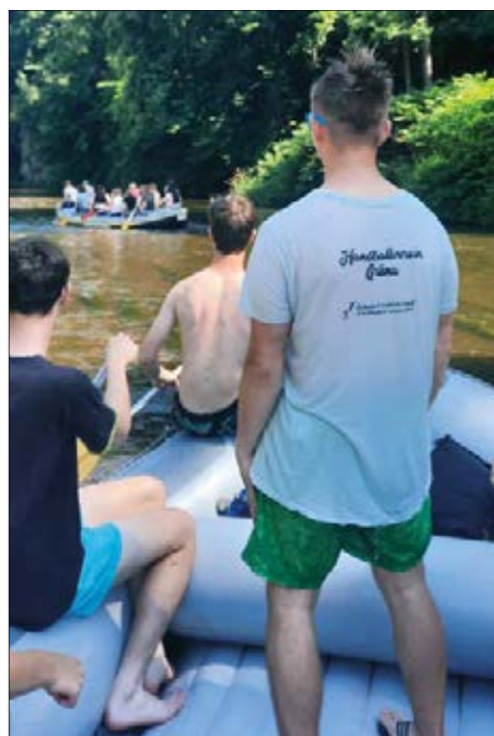
Ausflug der wB und mB im Schlauchboot

Weiterhin gab es in den einzelnen Mannschaften und Trainingsgruppen noch kleinere gemeinsame Aktionen wie Ausflüge oder Feierlichkeiten.