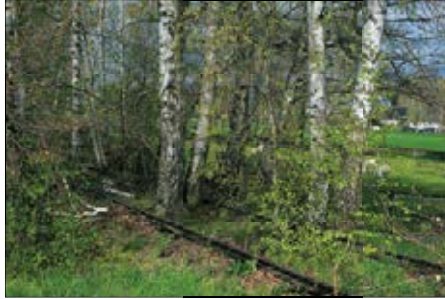
Originales Gleisstück in Röhrsdorf

(km 2,37). Das Pleißenbachviadukt in Kändler liegt versteckt und mittlerweile stark zugewachsen. Von der Auritztalbrücke an der A4 existieren noch die Widerlager und einzelne Fundamente der Stützpfeiler. Auch das Stationsgebäude in Rabenstein blieb bis heute erhalten.