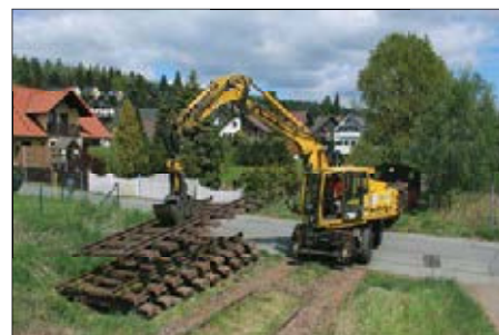
Abriss der Gleise im Jahre 2020

Anlässlich des 100-jährigen Jubiläums unserer Bahnlinie pendelten am 6. und 7. Dezember 1997 mehrmals dampflokbepannte Reisezüge zwischen Chemnitz und Wüstenbrand. Zum Einsatz kam dabei die Lok 50 3648 des Sächsischen Eisenbahnmuseums Chemnitz-Hilbers-