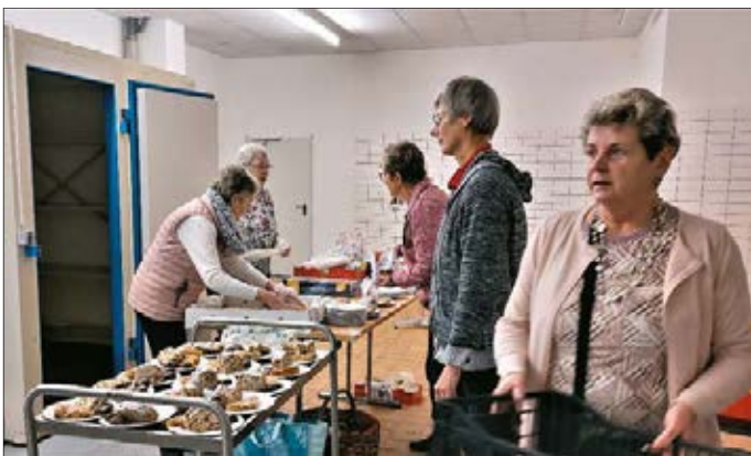
Zur Weihnachtsfeier im Kulturhaus waren die Helferinnen ab 10 Uhr im Einsatz, um die Tische für das Kaffeetrinken vorzubereiten.

Auch die langfristig von den Helfern vorbereitete Weihnachtsfeier konnte am 7. Dezember im Kulturhaus Grüna stattfinden, Das Echo war positiv, der Einsatz unserer Helferinnen und Helfer wurde von allen gelobt. Solche Begegnungen und Gespräche sind das, was in den zurückliegenden Jahren nur eingeschränkt möglich war, und diese Geselligkeit wurde besonders gewünscht.