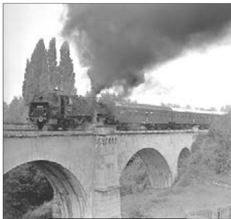
Der Pleißenbachviadukt in Kändler mit einer Sonderfahrt, Juni 1983 (Thomas Böttger)

Auf der Limbach-Wüstenbrander Strecke kamen fast ausschließlich Lokomotiven und Wagen sächsischer Bauart zum Einsatz. Lokbehandlung und Beheimatung erfolgten in Limbach, wo entsprechende Anlagen zur Verfügung standen. Die sächsischen Tenderlokomotiven der Bauart IIIb T, IV T (spätere Baureihe 71.3) und XIV HT (Baureihe 75.5) waren typische Zugpferde im Laufe der Zeit. Auch die Baureihen 64, 94.20 (XI HT) und 38.2-3 (XII H2) kamen auf die Strecke. Der Wagenpark war überwiegend aus zweiachsigen sächsischen Abteilwagen (2. – 4. Klasse) gebildet, ergänzt durch den Gepäckwagen. Im Nahgüterverkehr wurden ab 1934 fabrikneue Kleindieselloks vom Typ Kö II von Limbach und Wüstenbrand aus eingesetzt. Der Abschnitt Grüna – Wüstenbrand hat als Teil der Güterzugstrecke von Küchwald wesentlich mehr Fahrzeuge gesehen, u. a. fallen darunter auch die DR-Diesellokbaureihen 106, 110, 118 und 132.