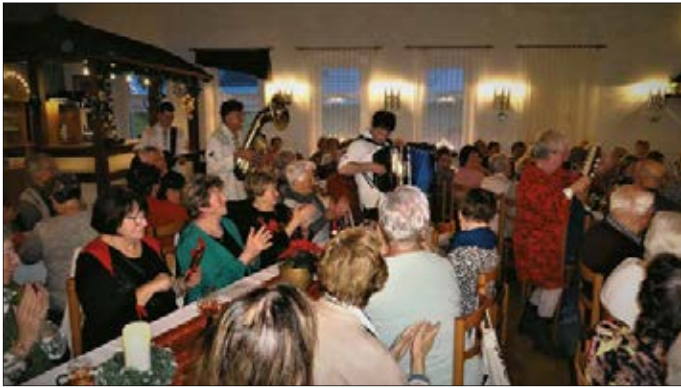
„De Hutzenbossen“ sorgten für Stimmung bei der Adventsfeier im „Erbgericht“ in Satzung am 2. Dezember

Im vergangenen Jahr war es uns möglich, unseren Mitgliedern wieder Tages- und Mehrtagesfahrten anzubieten – wir berichteten in der Dezember-Ausgabe darüber.