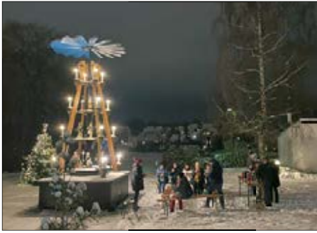
Einige neue Interessenten fürs nächste Jahr und natürlich viele Ideen gibt es

schon, daher freuen wir uns auf die Ausgabe 2023 und vertrauen auf eine gute Mund-zu-Mund-Propaganda. Bis dahin gibt es jede Menge zu tun im Jahreslauf.