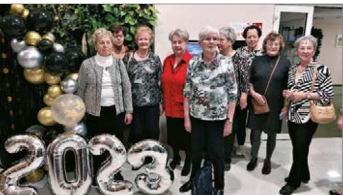
Mit Silvester in Sibyllenbad konnten 16 Frauen unserer Ortsgruppe einen vergnüglichen 5-tägigen Jahreswechsel erleben.