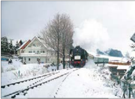
Dampfzug zum 100-jährigen Jubiläum der Strecke

dorf. Im oberen Bahnhof von Grüna konnte die Kleindiesellok der Lugauer Eisenbahnfreunde auf dem Nebengleis für Führerstandsmitfahrten genutzt werden. Immerhin letzteres ist 25 Jahre später – Familie Köstner sei Dank – wiederholbar. Von einem dampflokgeführten Sonderzug mit wunderbaren Grünaer und Rabensteiner Aussichten auf die Winterlandschaft konnte man anno 2022 jedoch nur noch träumen.