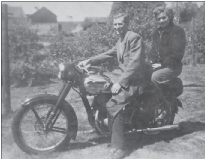
Mit Ehefrau auf seiner JAWA

Ein weiteres Hobby ist noch zu erwähnen: Motorradfahren. Schon Anfang der 50er Jahre hatte er eine JAWA. Nicht mit Sitzbank, sondern mit erhöhtem Sozis-Sitz! Und er ist gefahren, bis es altersmäßig leider nicht mehr ging.