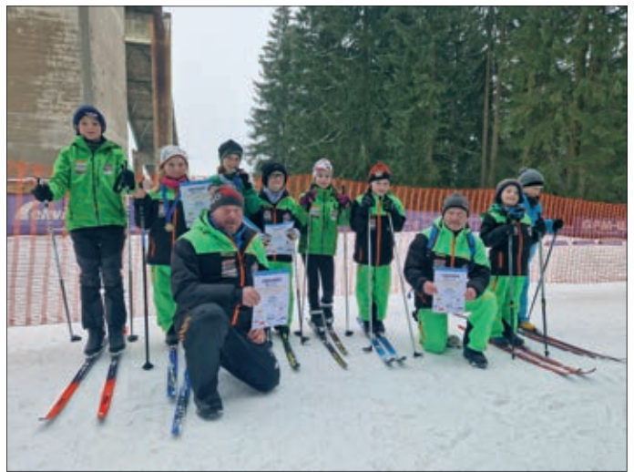
Erfolgreiche Sachsenmeisterschaften in Johanngeorgenstadt: Mit einigen Medaillen im Gepäck ging es nach dem Springen noch zum NK-Lauf auf die Langlaufski.

Zum Ferienende stand dann der Spaß im Vordergrund: Bei unserem Skifasching herrschte ein buntes Treiben an den kleinen Schanzen. Kleine Vampire, Schmetterlinge, Feen, Prinzessinnen und viele andere Gestalten wagten sich die Schanzen hinunter. Alle hatten großen Spaß im frisch verschneiten Wald, und die leckeren Pfannkuchen von Schäfers Backstuben wurden genüsslich verspeist.