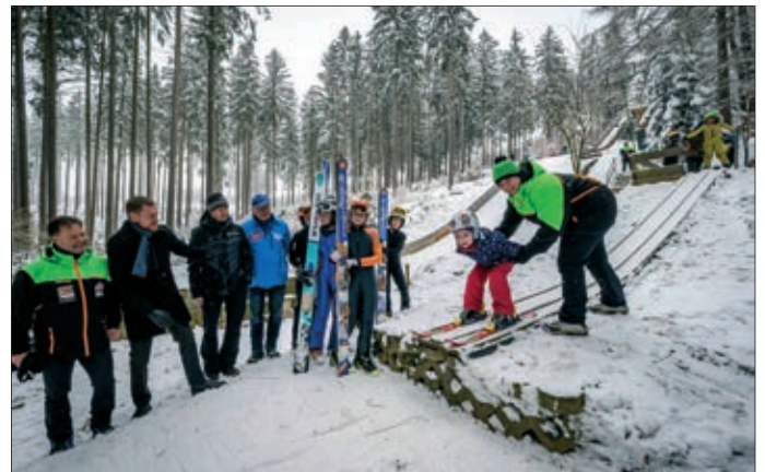
Auf allen Schanzen wurde trainiert. So konnten sich die Gäste direkt ein Bild von unserer Nachwuchsarbeit machen.