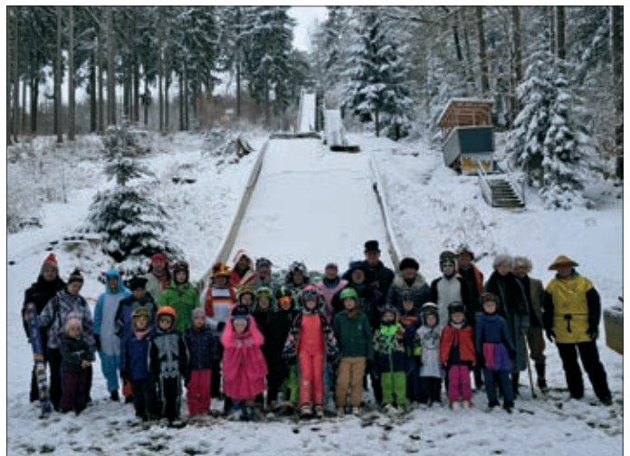
Pünktlich zum Skifasching verzauberte Frau Holle unsere Schanzen noch einmal in eine tolle Winterlandschaft.

Zum Ferienende stand dann der Spaß im Vordergrund: Bei unserem Skifasching herrschte ein buntes Treiben an den kleinen Schanzen. Kleine Vampire, Schmetterlinge, Feen, Prinzessinnen und viele andere Gestalten wagten sich die Schanzen hinunter. Alle hatten großen Spaß im frisch verschneiten Wald, und die leckeren Pfannkuchen von Schäfers Backstuben wurden genüsslich verspeist.