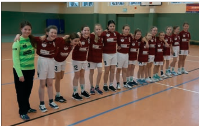
Unsere hoffentlich weiterhin gutgelaunten Mädels der D-Jugend