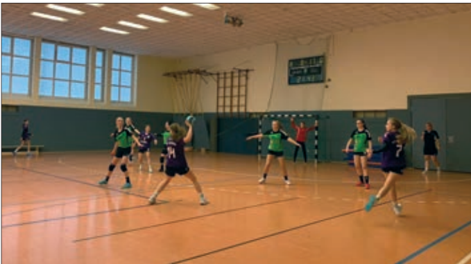
Unsere B-Jugend-Mädels auswärts auf Siegerkurs