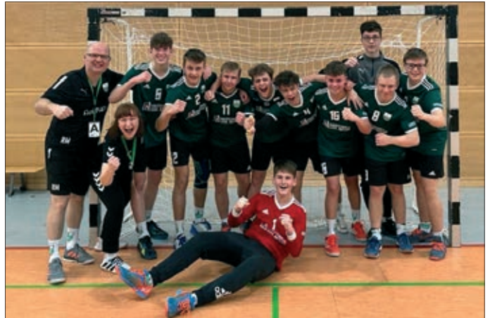
Die Jungs der B-Jugend nach dem Auswärts-Sieg gegen Annaberg

mehr mitkämpfen, der guten Entwicklung der Spieler stehen aber auch diese Niederlagen nicht im Wege.