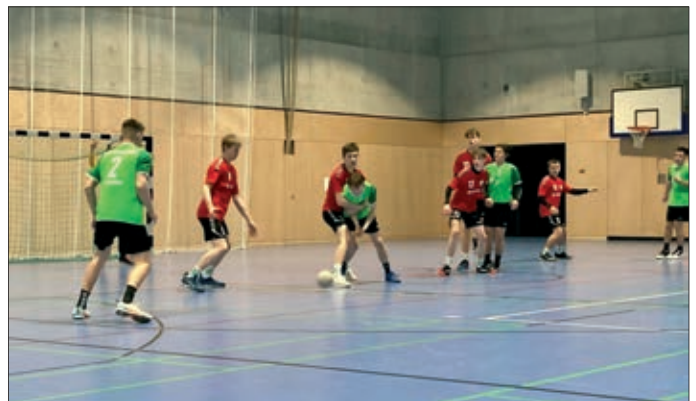
Unsere männliche A-Jugend im Einsatz

Wie schon einmal angemerkt, schicken wir dieses Jahr eine weibliche A-Jugend in den Spielbetrieb. Ähnlich wie die weibliche B-Jugend besteht diese ebenfalls aus Spielerinnen vom HV Gröna und dem BSV Limbach-Oberfrohna. Und auch die Trainer sind dieselben wie in der B-Jugend. Und als wäre diese Doppelbelastung für die Trainer nicht genug, starten mit unserem Team ausschließlich Mannschaften aus der Region Leipzig in die Saison. Einerseits ist es für die Mädels sicherlich toll, auch mal gegen unbekannte Gegner zu spielen, andererseits bedeutet das erheblich längere Fahrten zu den Auswärts-Spielen. Die Bezirksliga Staffel West wurde durch einen Patzer der Konkurrenz mittlerweile schon gewonnen, doch nun steht für die Mädels eine Finalrunde gegen die Staffel Ost mit weiteren 4 Spielen an. Und als wären die Touren nach Leipzig nicht schon genug gewesen, haben sich in der anderen Staffel noch Teams wie Lok Schleife und der VfB Bischofswerda qualifiziert, was Strecken von über 2 Stunden bedeuten. Damit steht unsere weibliche A-Jugend vereinsintern schon als Kilometerkönig fest. Ein erstes Spiel gegen Schleife wurde souverän gewonnen, der Titel des Bezirksmeisters der vier Bezirke ist das klare Ziel. Im Juni steht dann für die jungen Damen noch ein Turnier um die Sachsenmeisterschaft an, wir sind gespannt, ob dabei auch noch Erfolge gefeiert werden können.