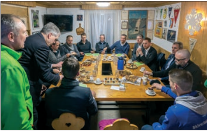
Volle (Ski-)Hütte: Nach dem Rundgang über unser Areal trafen sich alle Gäste zu einer sehr angenehmen und konstruktiven Gesprächsrunde.