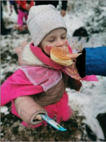
Unsere kleinen Vampire, Schmetterlinge und Prinzessinnen ließen sich natürlich auch die leckeren Pfannkuchen schmecken.