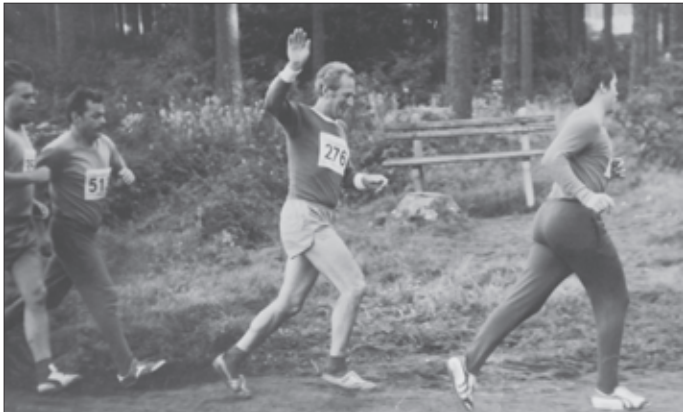
1980 beim Stauseelauf

Sportlich aktiv war er bis zum Alter von 72 auch als Cross-Läufer beim Stausee-, Adelsberg- oder Heidelberglauf. Oft gewann er in seiner Altersgruppe, kam aber meist unter den ersten 5 ein. Bei seinem letzten Heidelberglauf in Wüstenbrand wurde er als ältester Läufer mit 72 Jahren ausgezeichnet. Und auch Skifahren betrieb er mit Leidenschaft. Erst im Alter von 80 legte er seine Langlaufskier ab.