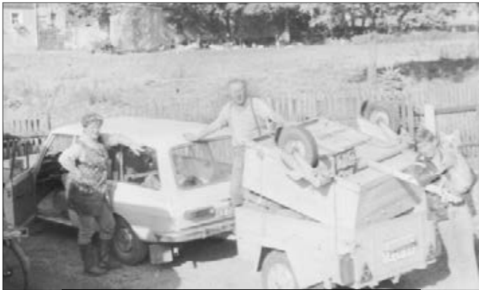
Rückholaktion für Moos-Klitscher und defekten Anhänger

Und man ließ sich als Gärtner etwas einfallen, Mangel zu überwinden. Die in der Vorweihnachtszeit üblichen Kerzen-gestecke wurden mit sogenannten „Moos-Klitschern“ hergestellt, wobei das Moos per PkW-Anhänger extra aus Thüringen geholt wurde. Ein überladener (das Moos war mit viel Wasser vollgesaugt) und deshalb defekter Anhänger musste unterwegs liegengelassen werden. Das Moos wurde dann mit neuem Hänger geholt – und der defekte fand darauf auch noch Platz.