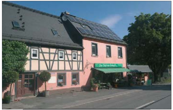
Außenansicht des Ladengeschäfts