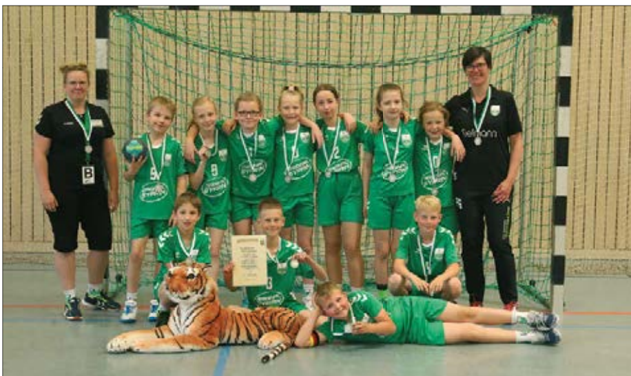
Zumindest eine Silbermedaille für die Saison um den Hals, gemischte Jugend-E