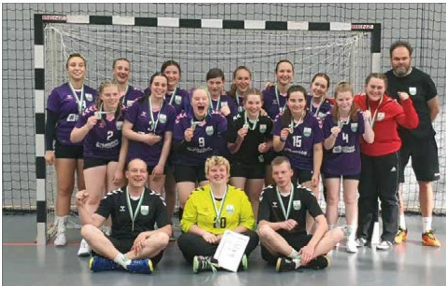
Unsere A-Jugend Mädels sind Vize-Sachsenmeister!

Nachdem die Saison 2022/23 nun endgültig abgeschlossen ist, konnten alle aktiven Spieler einige Wochen handballfreie Zeit genießen. Allerdings befinden sich alle Verantwortlichen des Vereins schon in der Planungsphase für die neue Saison. Es mussten Trainings- und Spielorte beantragt werden, die Trainer planen die Saisonvorbereitung, Schiedsrichter und Zeitnehmer hatten Weiterbildungen und nebenbei begannen nun auch die Baumaßnahmen in unserem Vereinszimmer, welches nach vielen Jahren der Planung und Diskussion endlich einen zweiten Fluchtweg erhält. Auch diese Baumaßnahme beschäftigt unsere