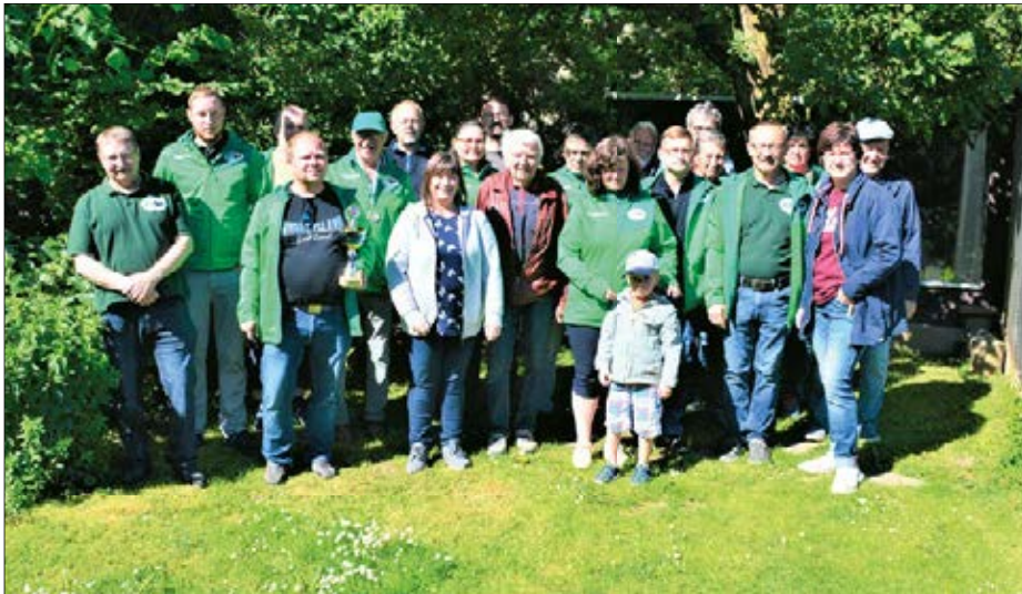
Gruppenfoto Wettkrähen 2023