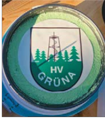
Der HVG...sogar auf der Torte

Und jetzt könnten wir noch die Saisonabschlussfeiern der einzelnen Mannschaften näher beleuchten, vom gemütlichen Grillabend mit passender Torte über Pizzaabend mit Übernachtung bis hin zum Schlauchboot- und Go-Kart-Fahren war wieder alles dabei, die Männermannschaft verbrachte gleich ein ganzes Wochenende zum Turnier in Klingenthal, aber das würde wieder viel zu viel Text werden.