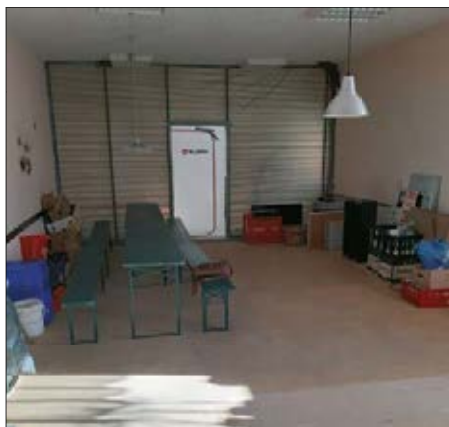
Unser Vereinszimmer im Baustellenmodus

Vereinsverantwortlichen und bringt die gewohnten Abläufe in und um die Turnhalle etwas durcheinander. Ganz davon abgesehen, dass es in unserem Vereinszimmer derzeit nicht gerade gemütlich aussieht.