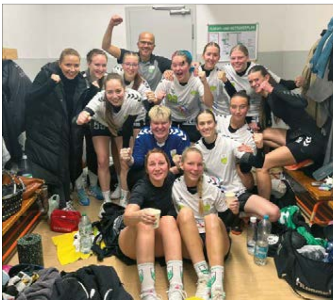
Unsere hochmotivierte und gutgelaunte Frauenmannschaft

Unsere neu gegründete Frauenmannschaft muss, wie im letzten Ortschaftsanzeiger erwähnt, im Kreis starten und hat als erklärtes Ziel den direkten Aufstieg. Bisher verläuft alles nach Plan, alle bisherigen 5 Partien wurden mit zweistelliger Tordifferenz gewonnen. Natürlich ist unsere Mannschaft, wel-