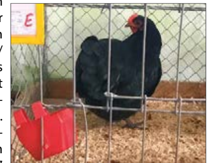
HV96 für eine Zwerg-Australorps von ZG Storch.