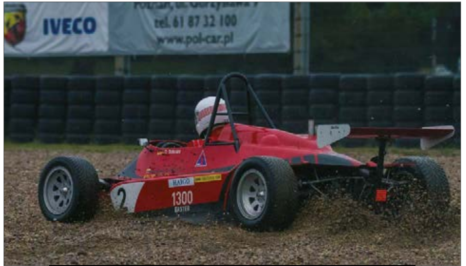
Im Kiesbett beim Rennen in Poznan