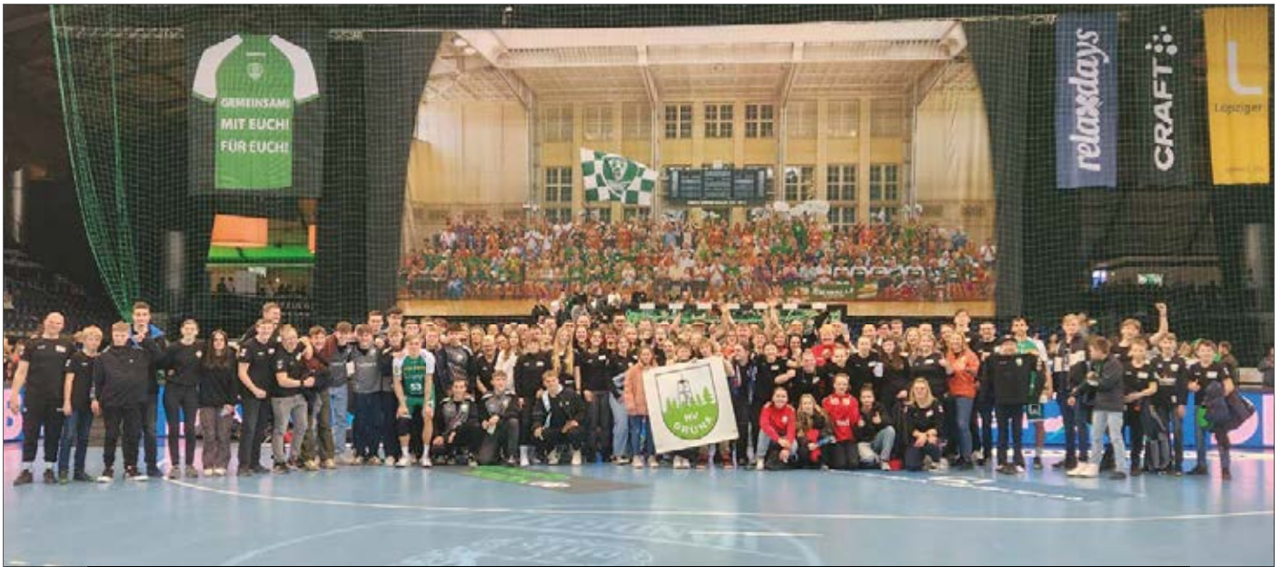
Der HV Gröna mal als Fan-Tross in Leipzig

Wir wünschen allen Sportlern, allen Trainern, allen Vorstandsmitgliedern, allen übrigen Mitgliedern des HVG sowie allen Lesern des Ortschaftsanzeigers ein besinnliches Weihnachtsfest und einen guten Rutsch ins neue Jahr! Ein besonderer Dank gilt an dieser Stelle unseren Sponsoren, denn ohne Trikots, Trainingsmittel oder Geldmittel für Hallenzeiten oder Vereinsaktivitäten wäre unser Verein nicht derselbe. Dabei sind wir