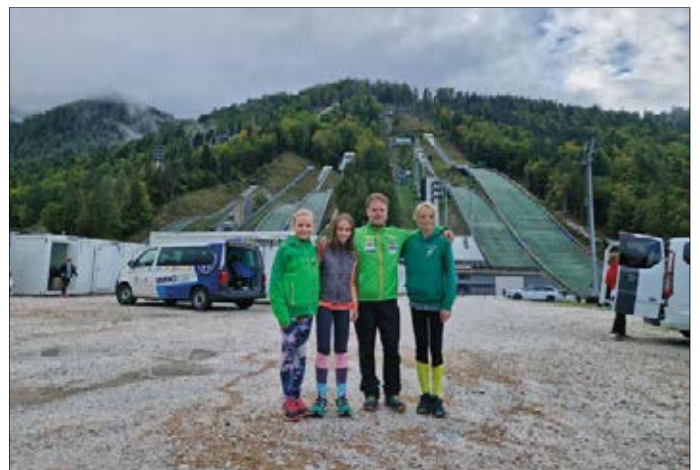
An diesem Ort sind alle Springerinnen und Springer gern: im „Tal der Schanzen“ in Planica

Neben schönen Sprungeinheiten auf der K30 Schanze absolvierten unsere drei Sportler auch souverän die nächste Herausforderung: die K60 Schanze in Villach. Am Mittwoch gab es dann noch ein absolutes Highlight – ein Training im „Tal der Schanzen“ in Planica (Slowenien). Absolut beeindruckend diese Anlage!