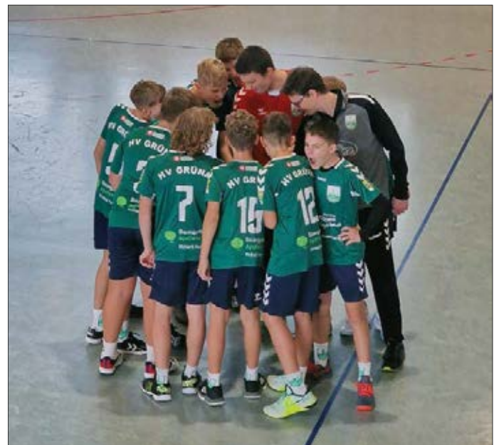
Motivation der C-Jugend-Jungs vor dem Spiel

In der B-Jugend haben wir diese Saison leider nur ein weibliches Team im Spielbetrieb, welches in Kooperation mit dem BSV Limbach-Oberfrohna zustande kommt. Die Mädels stehen nach 4 Spielen bei 3 Siegen und einer Niederlage ebenfalls auf