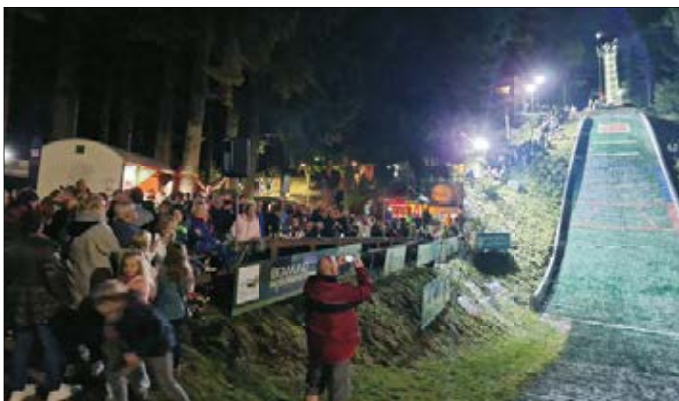
Wunderbare Stimmung an der Gußgrundschanze: die vielen Zuschauer bejubelten Super-Sprünge bis 42 Meter