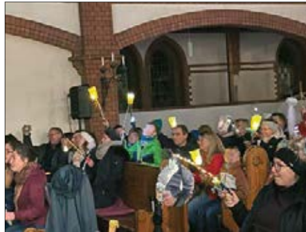
Laternenleuten in der abgedunkelten Kirche

Begleitet wurde seine weiße Stute diesmal von zwei kleinen Shetlandponys. Sie führten den Zug über die Dorfstraße und Chemnitzer Straße hin zur Kreuzkirche, in der im Anschluss noch die Geschichte vom Sankt Martin, der mit einem Bettler seinen Mantel teilt, durch ein kleines Anspiel gezeigt wurde. Dass es um Menschlichkeit und Miteinanderteilen in einer damals wie heute oft kalten Welt geht, wurde von den Darstellern kindgerecht vermittelt. Nicht nur der Mantel wurde geteilt, auch das Brot, so dass alle ihr Auskommen finden. Wie das Teilen genau funktioniert, wurde nochmal anhand eines überdimensionalen Martinshörnchens gezeigt. Ob das auch wirklich klappt, konnte dann