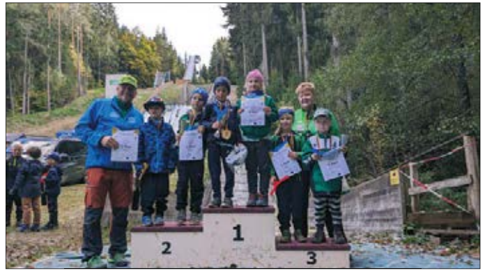
Kleine Adler ganz groß: Unsere Miniskifliegerinnen und -flieger in Bad Elster