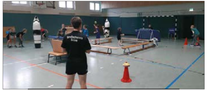
Spiel und Spaß beim Herbstferiencamp des HVG

Und dann sind da auch noch die vielen Vereins-Aktivitäten außerhalb des Spielbetriebs: über unsere Fahrt nach Zinnowitz im Sommer, als Trainingslager für die größeren Jugendmannschaften, hatten wir im letzten OAZ schon ausführlich berichtet. In den Herbstferien fand wieder 3 Tage unser mittlerweile bewährtes Feriencamp für unsere F- und E-Jugendlichen statt, bei dem es neben dem sportlichen Dazulernen hauptsächlich um viel Spaß und Freude an der Bewegung mit dem Ball geht.