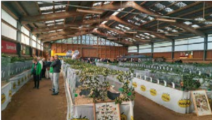
Schön geschmückte Ausstellungshalle in Kaufungen

Positive Überraschungen gab es bei der ersten Ausstellung in Kaufungen. Einige unserer Züchter präsentierten ihre Tiere das erste Mal.