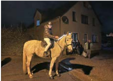
St. Martin und sein Pferd

Begleitet wurde seine weiße Stute diesmal von zwei kleinen Shetlandponys. Sie führten den Zug über die Dorfstraße und Chemnitzer Straße hin zur Kreuzkirche, in der im Anschluss noch die Geschichte vom Sankt Martin, der mit einem Bettler seinen Mantel teilt, durch ein kleines Anspiel gezeigt wurde. Dass es um Menschlichkeit und Miteinanderteilen in einer damals wie heute oft kalten Welt geht, wurde von den Darstellern kindgerecht vermittelt. Nicht nur der Mantel wurde geteilt, auch das Brot, so dass alle ihr Auskommen finden. Wie das Teilen genau funktioniert, wurde nochmal anhand eines überdimensionalen Martinshörnchens gezeigt. Ob das auch wirklich klappt, konnte dann