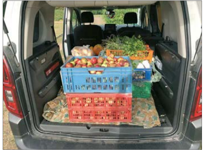
Wolfgang Bienert Kleingartenverein Waldesluft Grüna e.V.

ihrer Suppenküche zu täglich 150, am Monatsende bis zu 300 Portionen Mittagessen verwandeln und an Bedürftige ausgeben. Mit den vielen Blumen schmückten sie ihr Haus. Sie bedankten sich für unsere Unterstützung ganz herzlich und schickten wie jedes Jahr ihre Segenswünsche unseren Mitgliedern, die das möglich gemacht haben.