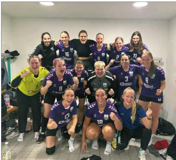
Die A-Jugend-Mädels nach einem erfolgreichen Spiel

Bei den A-Jugendlichen haben wir wieder sowohl männliche, als auch weibliche Teams im Spielbetrieb. Die Mädels müssen dabei, wie im letzten Jahr, für alle Auswärtsspiele in den Bezirk Leipzig reisen, da es leider keine Gegner-Teams in unserem Bezirk gibt. Dies hat aber den Vorteil, dass die Mädels auf keine jahrelang bekannten Gegner treffen. Bisher konnten 4 teilweise deutliche Siege eingefahren werden, leider gab es auch eine herbe Niederlage gegen LSG Löbnitz. Allerdings spielen die Mädels eine Dreierunde, somit gibt es noch zweimal die Gelegenheit auf Revanche.