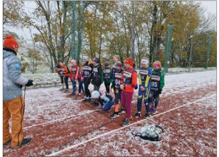
Da steigt die Vorfreude auf den Winter: den Ausdauerlauf zum Athletiktest absolvierten die Sportler im dichten Schneefall von Oberwiesenthal

Der letzte Wettkampf der Sachsenpokal-Sommersaison war der Athletiktest in Oberwiesenthal. In der Eliteschule des Wintersports mussten verschiedene Disziplinen absolviert werden, u. a. 1.000m-Lauf, Sprint, Stand-Weitsprung, Dreierhopp und ein Koordinationslauf. Besonders der 1.000m-Lauf auf der Außenbahn war sehr interessant. Passend zum Wintersport schneite es dicke Flocken. Besonders für die Trainer ist die Auswertung des Athletiktests von besonderer Bedeutung. Dort können Defizite erkannt und dann im Athletiktraining langfristig behoben werden. Nun hoffen wir auf Schnee, damit die Wintersaison planmäßig stattfinden kann.