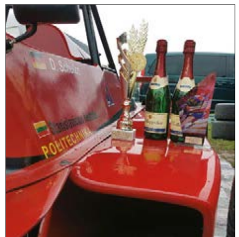
Gleich 2 Trophäen auf dem DTM-Lausitzring 2019