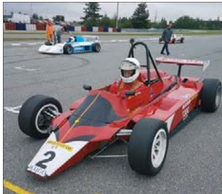
Beim Carboniacup 2015 in Most

Seitenkästen den Wagen an den Boden drückt. Der Motor ist ein 21011-Lada-Motor mit 1300 ccm Hubraum und bis zu 8500 Umdrehungen, das umgebaute Getriebe stammt vom Saporoshez 968. Dank Gitterrohrrahmen und Glasfaserteilen in der Verkleidung wiegt der Wagen nur 420 kg und kommt mit 120 PS auf 220 km/h. Alle von der FIA geforderten sicherheitsrelevanten Teile sind vorhanden, ansonsten nur Originalteile, wie es in den Rennen, an denen diese Wagen teilnehmen, gefordert ist. Gefahren wird mit Flugbenzin (Kerosin mit 108 Oktan).