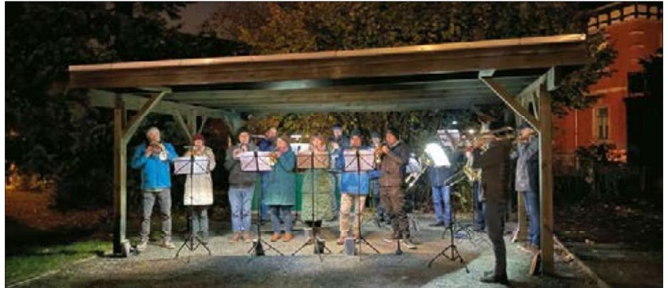
Begrüßung an der Kirche durch den Posaunenchor

Pünktlich zum Start verhängten wieder dicke graue Regenwolken den Himmel. Trotzdem waren unerwartet viele Familien mit ihren Kindern gekommen, um am Umzug teilzunehmen. Regenschirm reihte sich an Regenschirm, was den großen Nachteil hatte, dass das Pferd unseres „Martins“ dadurch verunsichert war und Martin sich daher leider nicht den Leuten nähern konnte, um sich bestaunen zu lassen.