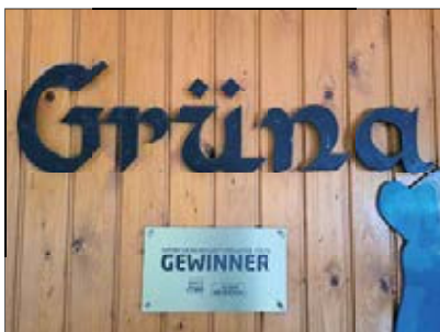
Das Vereinswettbewerbs-Preisträgerschild erhielt sofort einen Ehrenplatz an unserer Skihütte in Gröna

Ab sofort dürfen wir uns Botschafter für „so geht sächsisch“ nennen – als einer von 222 sächsischen Sportvereinen wurden wir vom Freistaat ausgewählt und erhielten außerdem eine Prämie des Freistaates in Höhe von 1.000 Euro. Nun prangt