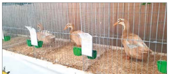
Sachsenenten von Zuchtgemeinschaft Nawroth

Einige unserer Mitglieder stellten zum ersten Mal außerhalb von Grüna/Mittelbach aus. Wie immer machte den Anfang die Werbeschau in Kaufungen Mitte Oktober. Diese war wie immer einen Besuch wert, egal, ob als Aussteller oder als Interessent des Federviehs oder der Kaninchen.