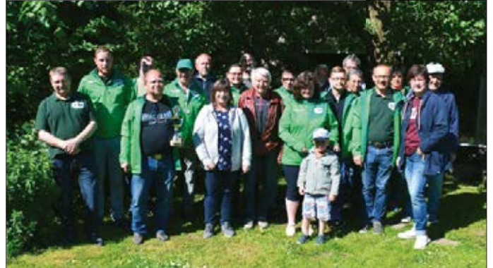
Gruppenfoto zum Wettkrähen 2023