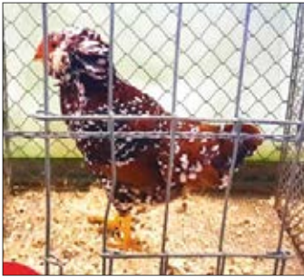
Zwerg-Orloff, rotbunt von ZG Storch

Umso erfreulicher sind die Ergebnisse, die sie mit nach Hause brachten. Ihnen möchte ich besonders gratulieren und Mut für die nächsten Jahre machen. Auch wird es Rückschläge geben und man wird mit dem Urteil des Preisrichters nicht immer einverstanden sein. Hier heißt es dann mitunter, selbstkritisch zu sein und nicht den Kopf in den Sand zu stecken. Zeitgleich mit Kaufungen fand, wie schon in meinem letzten Bericht erwähnt, eine Vorstellung unseres Vereines zum Obstbaumtag in der Baumschule Hohenstein-Ernstthal statt. Danke auch an all die anderen Aussteller unseres Vereines, die uns würdig in ganz Deutschland vertreten haben.