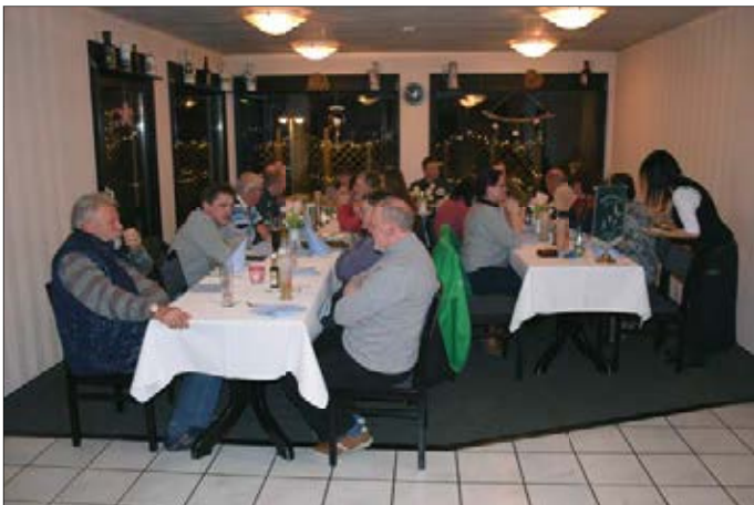
JHV im Hotel Abendroth

Nun zum eigentlichen Rückblick auf unser Vereinsleben im Jahr 2023 . Wie bereits in den vergangenen Jahren zuvor, konnten wir unseren Mitgliederstand konstant halten bzw. sogar vergrößern. Es gab 2 Kündigungen und 5 Neuanmeldungen der Mitgliedschaft, was einen Mitgliederstand von 37 bedeutet. Die gute Arbeit des Vorstandes wurde zur Jahreshauptversammlung im März mit seiner Neuwahl bestätigt. Mein Dank geht hier an alle Mitglieder, die uns ihr Vertrauen geschenkt haben.