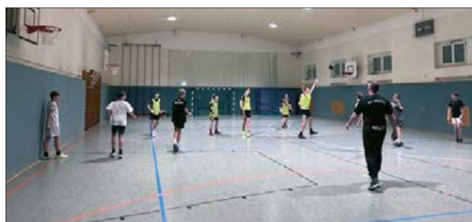
Ohne Handball geht es einfach nicht – die C-Jugend am Abend

Am 19.01. folgte dann die Weihnachtsfeier der Mädchen der weiblichen A- und B-Jugend. Diese genossen einen ruhigen Abend mit gemeinsamen Essen und Spielen.