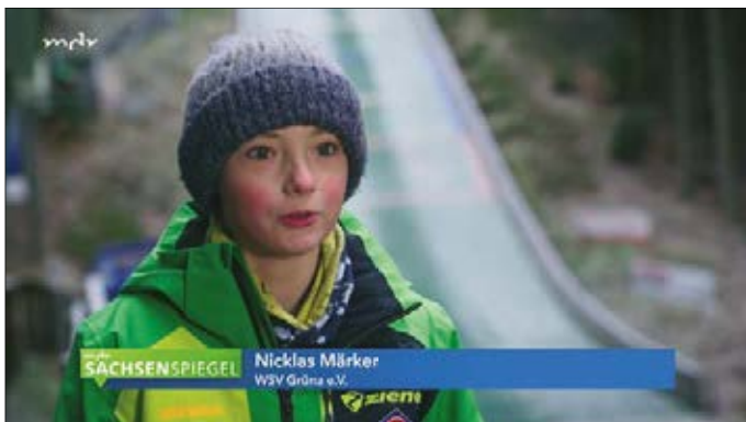
Screenshot aus dem Beitrag im MDR-Sachsenspiegel vom 9. Januar

Mit weiterer finanzieller Unterstützung der Stadt Chemnitz sind wir nun in der Lage, ein Planungsbüro zu beauftragen. Auch der Mitteldeutsche Rundfunk MDR ist darauf aufmerksam geworden und hat uns Anfang Januar mit einem Kamerateam besucht. Ein aufregendes Training für unsere Sportler und Trainer. Im Sachsenspiegel wurde am 9. Januar ein schöner Beitrag gezeigt.