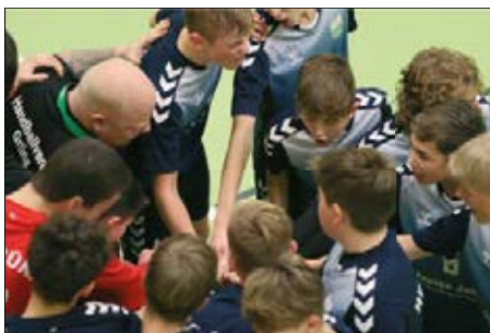
Emotionale Auszeit beim Spitzenspiel der C-Jugend-Jungs

Am 07.01.24 spielten dann unsere jüngeren Teams im gewohnten Umfeld des André-Gymnasiums und konnten ebenfalls einige Punkte holen. Besonders emotionsgeladen war hier das Spitzenspiel in der männlichen C-Jugend gegen den