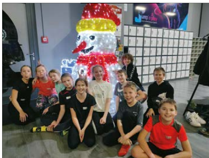
Unsere gemischte Jugend D im Jump`n Play

Aber auch die Jugendmannschaften nutzen gern die Turnhalle und unser Vereinszimmer. So wie die männliche C-Jugend am 12.01., die auch, wie allseits bei den Kindern beliebt, gleich in der Turnhalle mit ihren Trainern übernachteten. Wobei natürlich weniger der Schlaf im Vordergrund stand. Zuvor musste aber auch zu später Stunde noch ein sportlicher Vergleich sein.