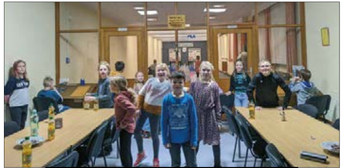
Weihnachtsfeier der gemischten E-Jugend auf der Kegelbahn

Vielmehr möchten wir euch in dieser Ausgabe von unseren vorweihnachtlichen Aktivitäten berichten. Den Anfang machte dabei die Weihnachtsfeier der gemischten E-Jugend am 08.12.23 auf der Kegelbahn und in unserem Vereinszimmer.