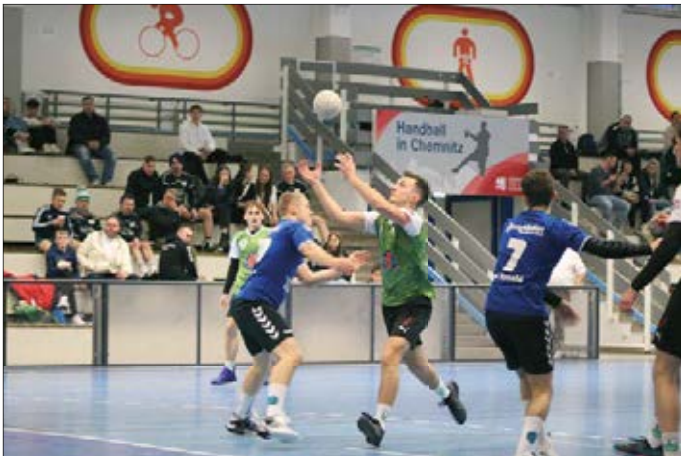
Heimspieltag des HVG einmal in der Sachsenhalle

Unser Jahr begann spielerisch nach einer kurzen Weihnachtspause direkt am ersten Wochenende mit einem Heimspieltag. Am Samstag, den 06.01.24, hatten wir die Möglichkeit für unsere „großen“ Teams die Sachsenhalle zu nutzen, welche optimale Gegebenheiten bietet. Es gibt ausreichend Parkmöglichkeiten, eine tolle Tribüne und ein abgeschlossenes Bistro, für uns definitiv ein Highlight in der laufenden Saison. Leider ist die Halle von den Vereinen „Union Chemnitz“, dem „HVC“ und dem „HC Buteo“ in der Regel voll ausgelastet, weshalb ein Spieltag in der Sachsenhalle eher eine Seltenheit ist. Spielerisch wussten die männliche und weibliche A sowie die 2. Männermannschaft zu überzeugen. Die Männer 1 mussten dagegen in einem am Ende spannenden Spiel einen herben Rückschlag im Kampf um die Meisterschaft hinnehmen. Das letzte Spiel sollten die Frauen austragen, dieses wurde allerdings kurzfristig vom Gegner abgesagt. Sollten wir in der Zukunft noch einmal die Möglichkeit für einen Spieltag in dieser tollen Halle anbieten können, werden wir euch auf den sozialen Medien (Facebook, Instagram und auf dem WhatsApp-Kanal) informieren.